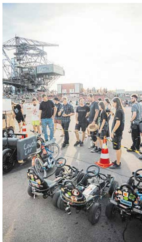
Die Besucher des Macher Festivals wollen selbst Hand anlegen. Handwerksbetriebe können sich mit einem Stand am Festivalgeschehen beteiligen.

Laut den Veranstaltern setzen Ausbildungsbetriebe auf das Macher Festival als innovatives Kennenlern- und Teamevent für ihre Auszubildenden. Hunderte Azubis aus ganz Deutschland werden von ihren Firmen entsendet - als Investition in Motivation,