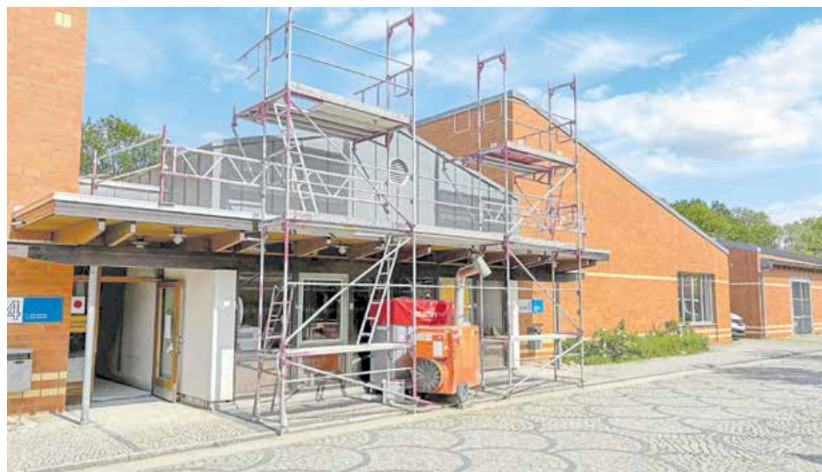
Am Standort Holleben starten im August 2025 die überbetrieblichen Lehrgänge der Bauausbildung. Derzeit laufen noch Renovierungsarbeiten an den Ausbildungshallen.

Beim Umzug wird der vorhandene Maschinenpark übernommen. Neuanschaffungen sind nicht geplant. Ausgenommen ist lediglich der Ersatz