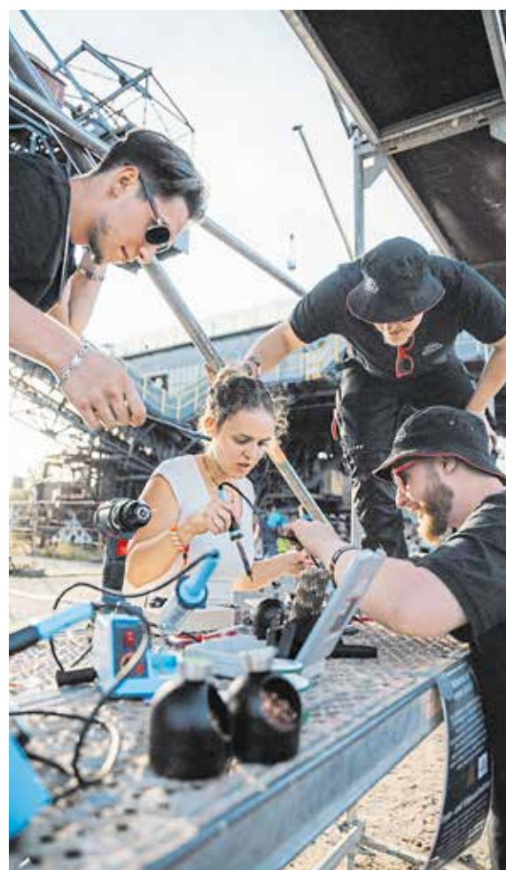
Auf dem Ferropolis-Gelände, einem ehemaligen Tagebau bei Gräfenhainichen, kommen im August Handwerker, Bastler und Tüftler zusammen.

Gemeinschaft und handwerkliche Begeisterung.