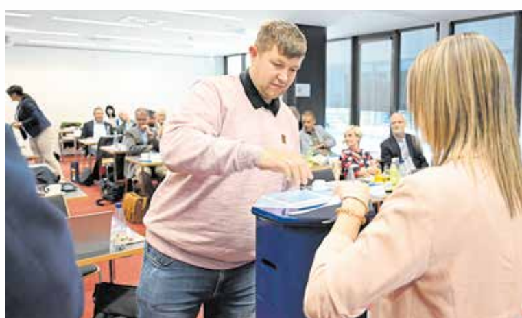
Die Vollversammlung war dazu aufgerufen, die Stelle des Vizepräsidenten Arbeitnehmerseite neu zu besetzen. Die Wahl erfolgte geheim.

die aktuellen Wahlergebnisse ein. Man müsse jetzt mit den politischen Vertretern ins Gespräch kommen und die Dinge ganz nach Handwerkerart selbst in die Hand nehmen und mitgestalten.