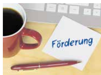
Die Bundesregierung will Unternehmen bei der Elektrifizierung ihrer Fuhrparks unterstützen.

Details zur Förderung (nach Angaben der Nationalen Organisation Wasserstoff- und Brennstoffzellentechnologie NOW): Jedes antragstellende Unternehmen kann genau einen Antrag stellen. Dabei gilt: Bei verbundenen Unternehmen stellen Tochterunternehmen mit eigener Rechtspersönlichkeit einen eigenen Antrag. Alle Anträge von verbundenen