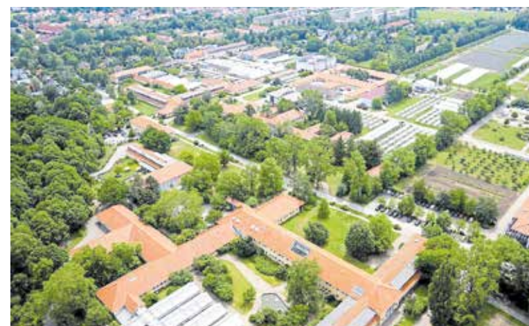
Auf dem Vergabekongress der Auftragsberatungsstelle Sachsen-Anhalt im Leibniz-Institut für Pflanzengenetik und Kulturpflanzenforschung haben Teilnehmer die Chance zum fachlichen Austausch und zum Netzwerken.

Antragstellung: www.hwkhalle.de/ladeinfrastruktur