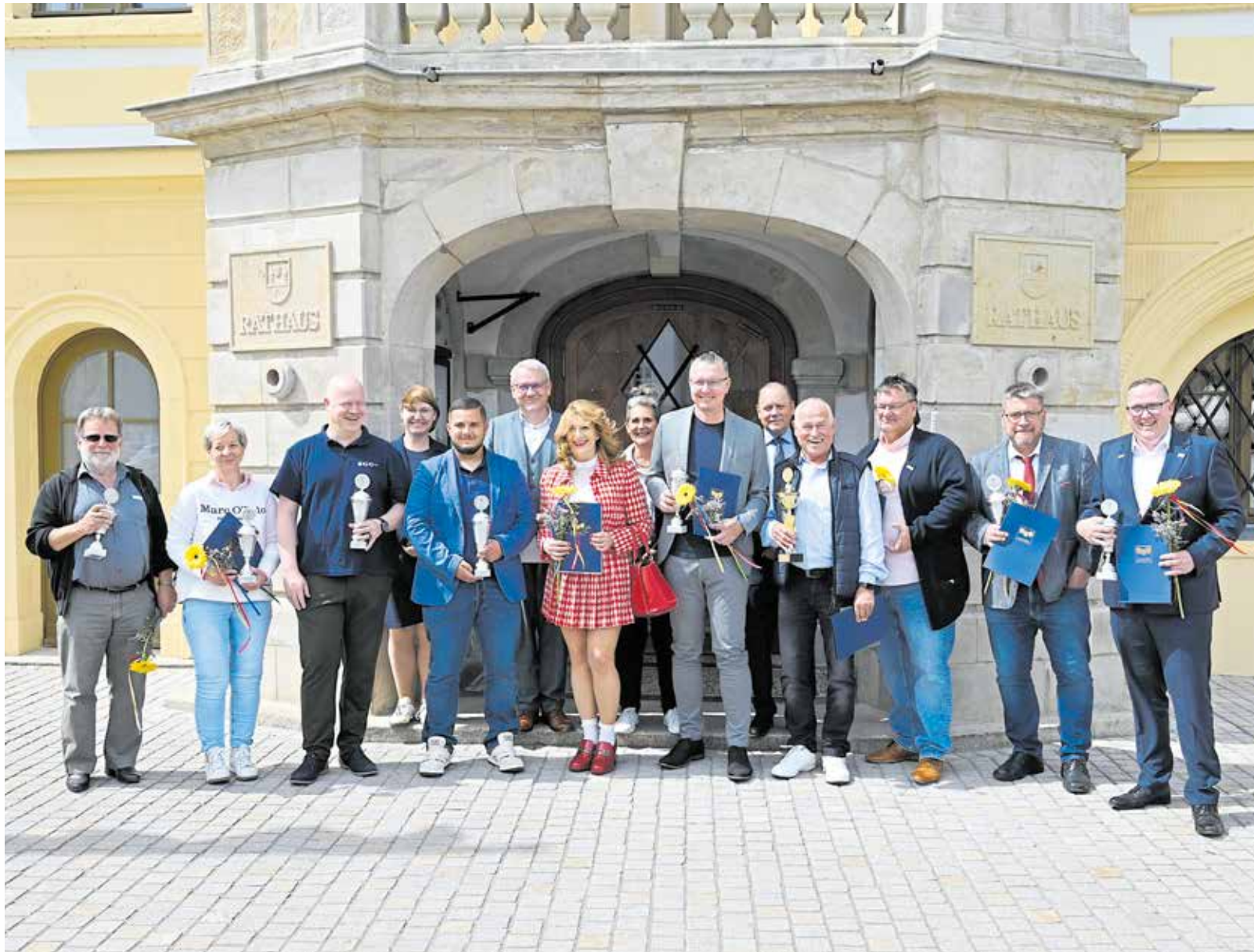
Erinnerungsbild nach der Preisverleihung. Die ausgezeichneten Handwerker und die Gäste freuten sich über einen gelungenen Wettbewerb und eine schöne Abschlussveranstaltung.