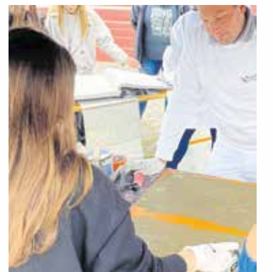
Handwerk zum Anfassen: Ausprobieren ausdrücklich erwünscht.

Mit dabei waren die Innung Sanitär-Heizung-Klima-Ofenbau Halle, die Maler- und Lackiererinnung Halle-Saalkreis-Merseburg, die Elektroinnung Halle-Merseburg-Saalkreis und die Dachdeckerinnung Halle.