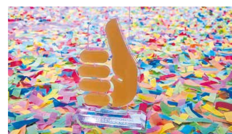
Erfolgreichen Teilnehmern der Deutschen Meisterschaft winkt ein Pokal. Viele sind jedoch besonders dankbar für neue Erfahrungen und neue Kontakte zu anderen Junghandwerkern.

Wie funktioniert die Anmeldung? Die Handwerkskammer Halle bittet alle Prüfungsausschüsse darum, bis