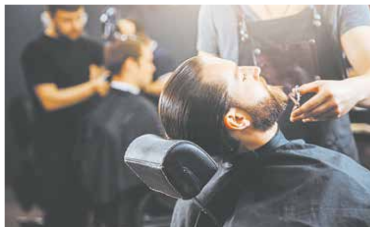
Sie sind inzwischen überall zu finden. Barbershops bieten offiziell Bartpflege an, aber oft auch Haarschnitte. Dafür muss ein Meister angestellt sein.

Aufgrund von Beschwerden aus dem Friseurhandwerk über unlautere Mitbewerber hat die Handwerkskammer im Juli eine Komplexkontrolle