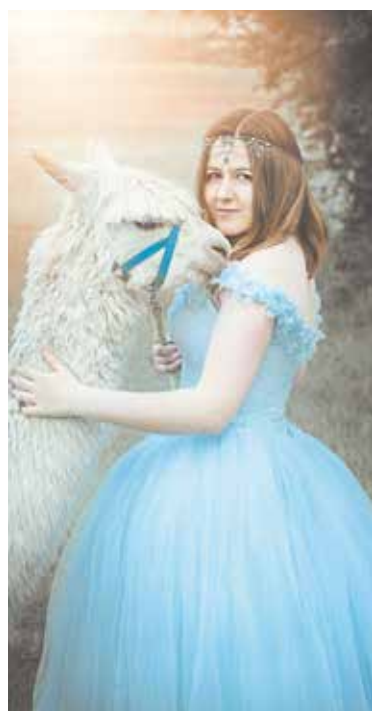
Als Models gebucht werden zum Beispiel Alpakas ...