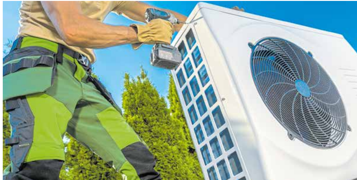
Ab 2045 ist der Betrieb von Heizungen, die ausschließlich auf fossilen Brennstoffen basieren, gesetzlich nicht mehr zulässig. Die Wärmepumpe ist seit einigen Jahren ein großes Thema und könnte für einige die neue Variante des Heizens werden.

Am besten sofort, denn auch wenn der Umstieg über einen Zeitraum von 20 Jahren bis 2045 schrittweise erfolgt, sollten Investitionsentscheidungen heute am Wärmeplan ausge-