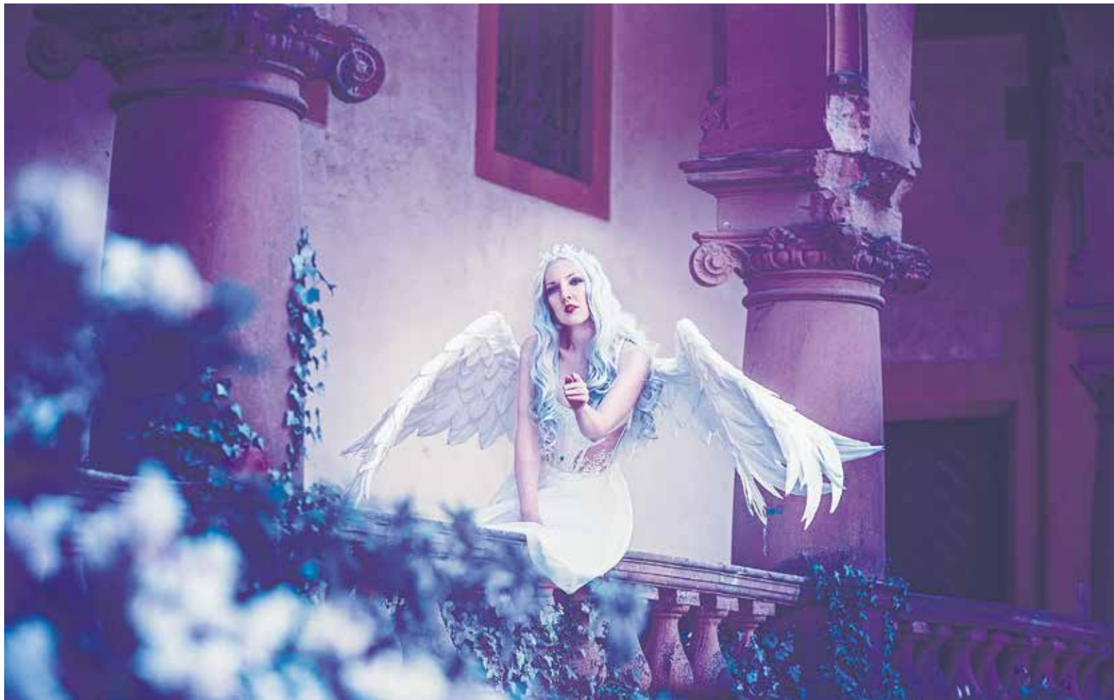
Die Fotos von Jana Conrad zeigen oft historische Gebäude. Passend zu den Motiven ihrer Bilder und ihrem Heimatort Wünsch hat sie sich unter dem Namen „VerWÜNSCHTE Fotografie“ selbstständig gemacht.