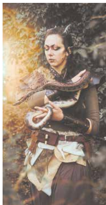
... oder auch Schlangen – je nach Kundenwunsch.

sind, achtet Jana Conrad, die selbst Haustiere hat, darauf, dass sie mit seriösen und tiereliebenden Partnern kooperiert und die Tiere keinen Stress erleben. Die Shootings von Jana Conrad sind so vielfältig wie die-