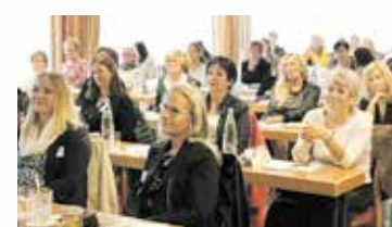
Zur „Regia“ kommen jedes Jahr ambitionierte Frauen aus der Region zusammen.

Unternehmerinnen aus Anhalt-Bitterfeld haben den Verein Regia e.V. gegründet, um sich auch zwischen