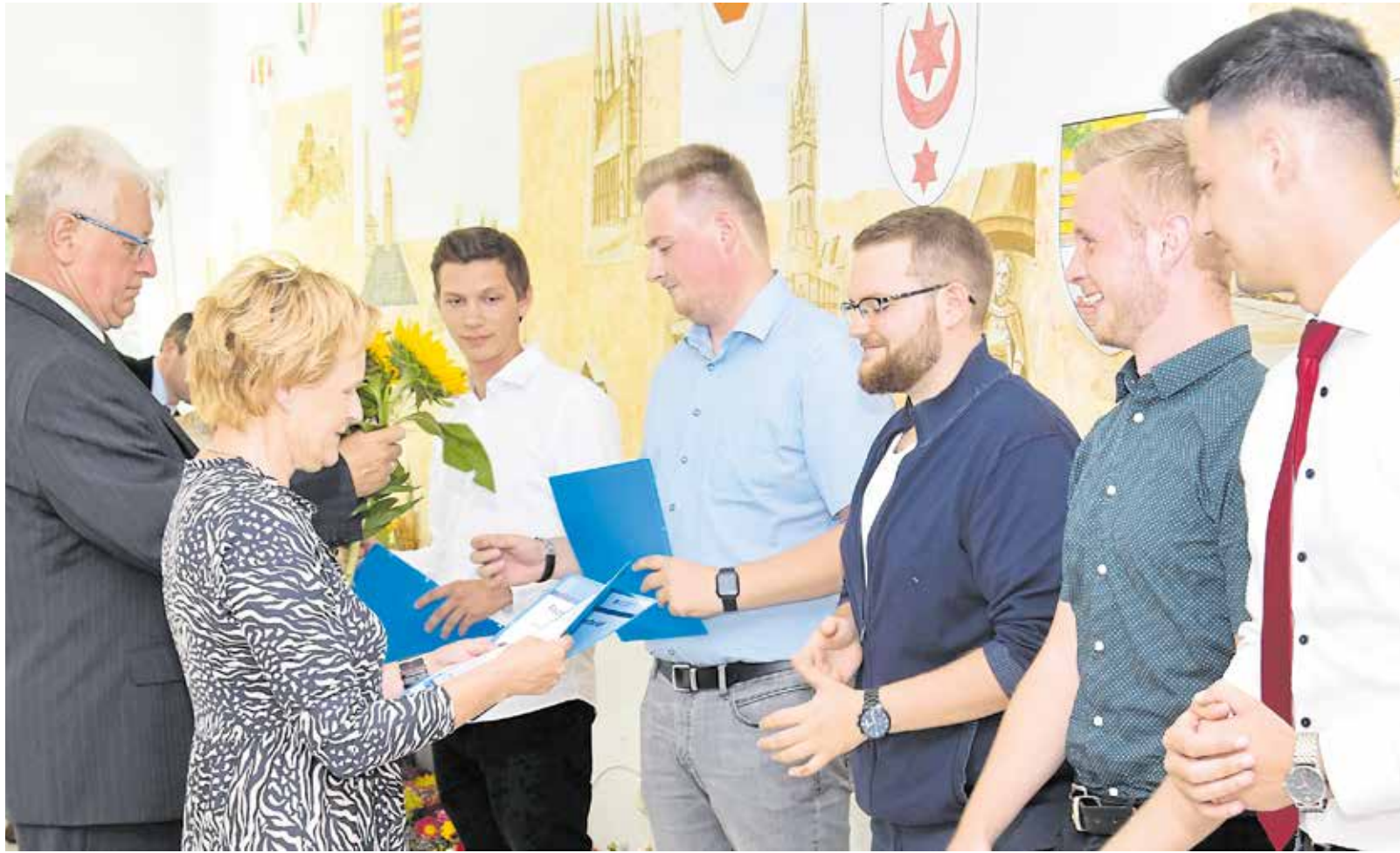
Mit der Freisprechung entließ die Handwerkskammer Halle erfolgreiche junge Leute in einen neuen beruflichen Lebensabschnitt. Mit dabei: Stolz Automobilkäufer, die jetzt ihren Facharbeiterbrief besitzen.