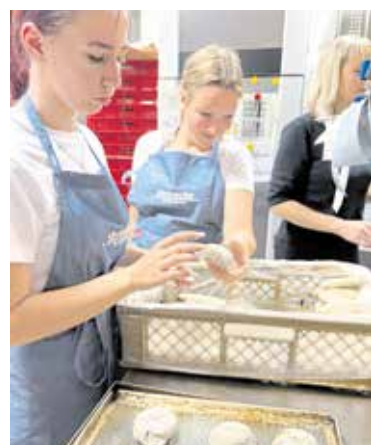
Bei der Brotmeisterei Steinecke wurde fleißig gebacken.