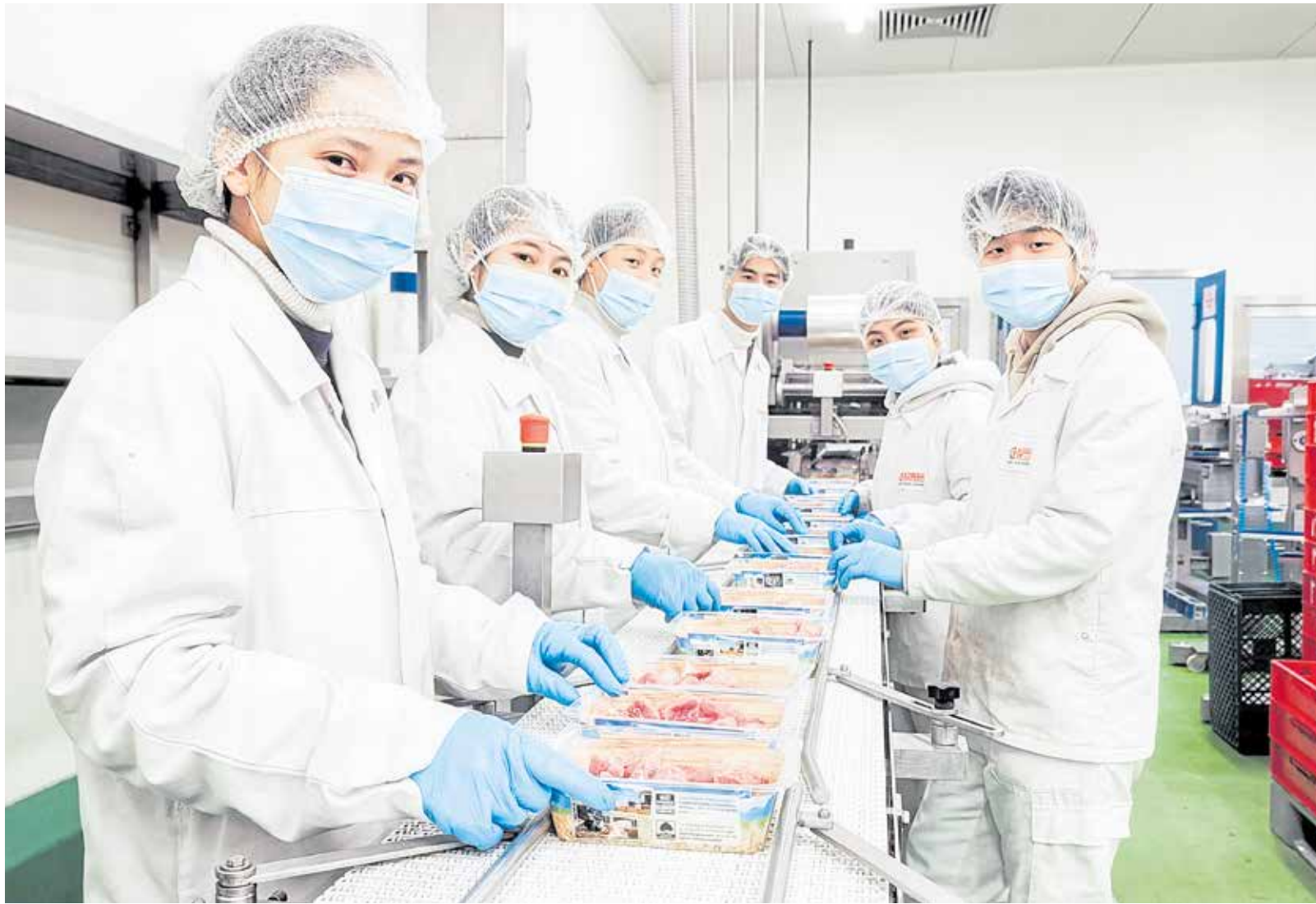
Das Fleischerhandwerk sucht dringend Nachwuchs. Die Fleischmanufaktur Dietzel in Teutschenthal hat junge Männer und Frauen aus Vietnam ausgebildet, die nun als Fachkräfte in der Fleischproduktion tätig sind. Bald sollen vier neue Lehrstellen besetzt werden – ebenfalls mit Vietnamesen, die gern nach Deutschland kommen möchten.