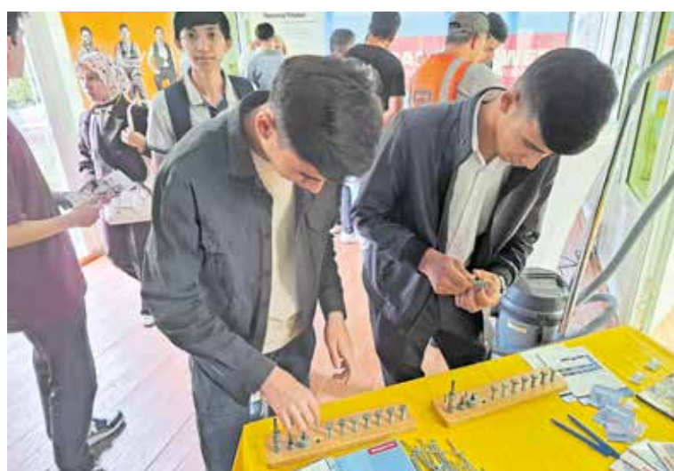
Auf der Berufsmesse in Taschkent testeten junge Usbeken ihr handwerkliches Talent und kamen mit Vertretern des Handwerks in Sachsen-Anhalt ins Gespräch.