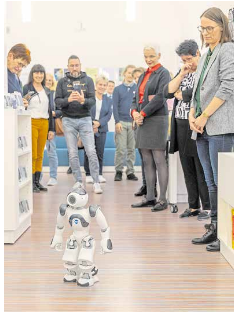
Er war der Hingucker auf der Preisverleihungsveranstaltung und soll in der Wittenberger Bibliothek das Interesse der jungen Besucher wecken: der programmierbare Roboter Nao.

Zu den Angeboten der Bibliothek gehören unter anderem Programmierkurse, thematische Ferienveranstaltungen oder der Erwerb eines 3D-Druck-Führerscheins. Für Kinder, Jugendliche und Erwachsene stehen Schneideplotter, eine Digitalisierstation für Dias, Negative und Fotos, eine digitale Stickmaschine, eine Nähmaschine und VR-Brillen sowie digitale Bausets, 3D-Stifte und mehrere Lernroboter zur Verfügung.