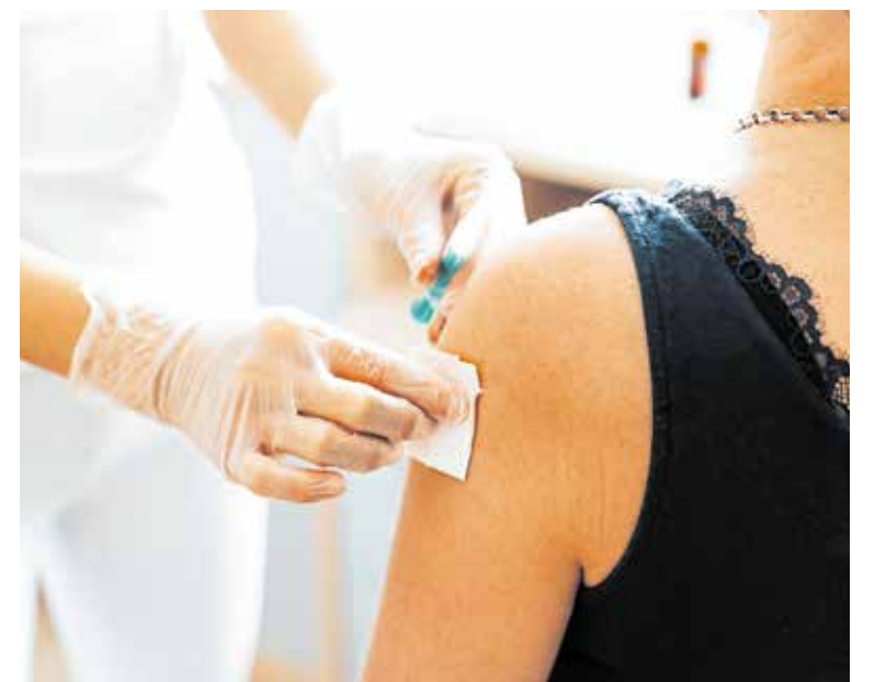
Die Coronapandemie und die Impfpflicht liegen schon etwas zurück, beschäftigen die Gerichte jedoch noch.