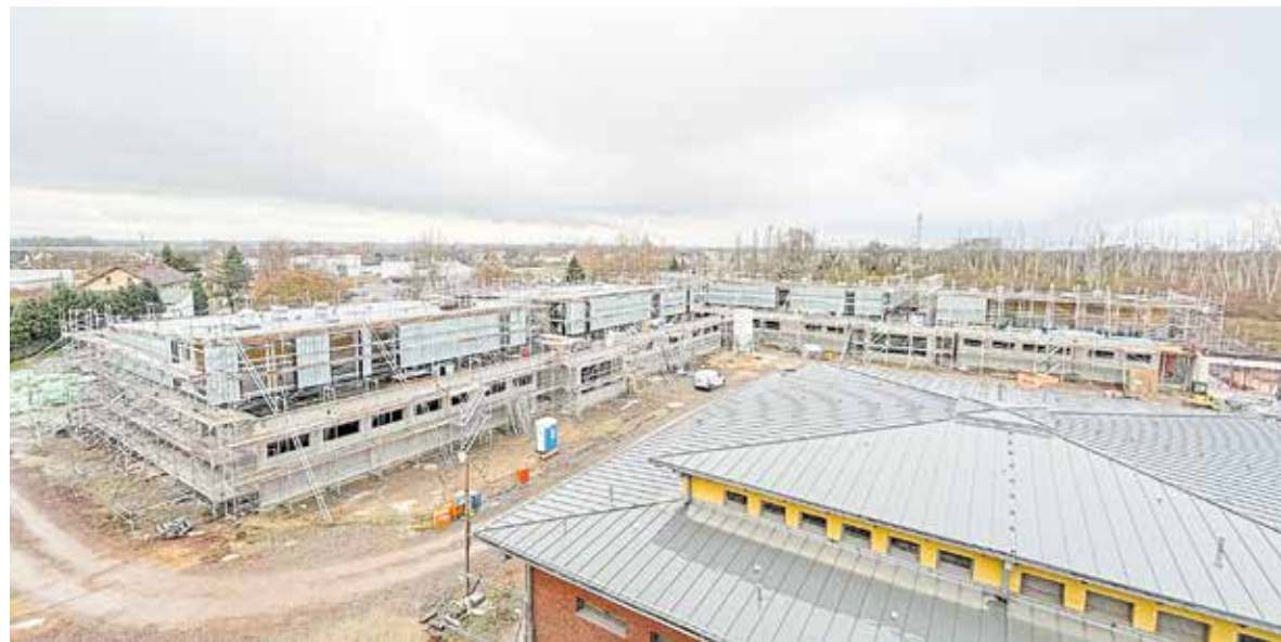
Auf der Südseite der Baustelle mit den Werkstätten für SHK, Elektro- und Metalltechnik sind die Bauarbeiten aktuell am weitesten fortgeschritten.

Auf der Südseite (Gebäude A-E) entstehen die Werkstätten der Fachbereiche Sanitär-, Heizungs- und Klimatechnik, Elektrotechnik sowie Metalltechnik mit den Schweißwerkstätten. Hier ist der Stahlbau bereits