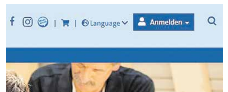
Das Einloggen erfolgt auf www.hwkhalle.de über ein Feld am oberen rechten Bildrand.

Tel. 0345/2999 201, mobil 0172 3633511, E-Mail: uthomas@hwkhalle.de Infos zum Login: www.hwkhalle.de/portal