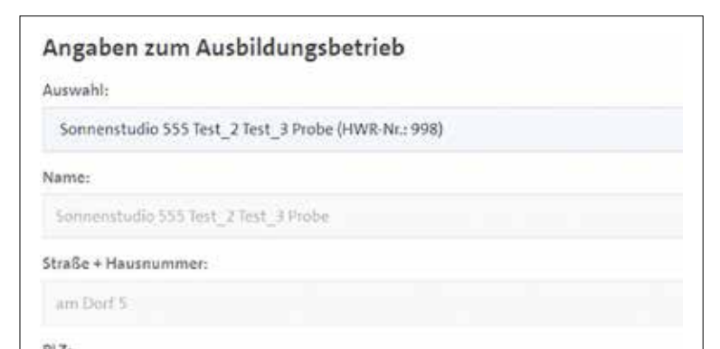
Einige Angaben, wie die Betriebsdaten, sind bereits automatisch eingetragen.