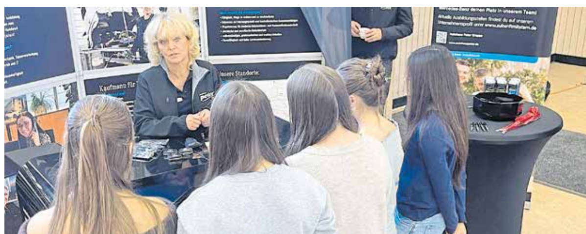
Ob Autohaus, Optiker, Hörgeräteakustiker, Elektro- oder SHK-Betrieb – Dessauer Gymnasiasten konnten sich an ihrer Schule über Handwerksberufe informieren.

Infos zur Berufsorientierung der Kammer: www.hwkhalle.de/berufsorientierung-2025