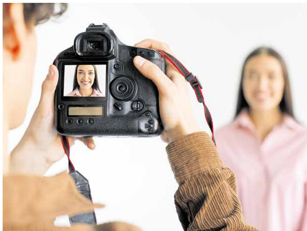
Passbilder sind für viele Fotografen eine wichtige Einnahmequelle. Durch das Aufstellen von Fotoautomaten treten einige Städte und Gemeinden in Konkurrenz mit den Fotostudios.

Die Handwerkskammer Halle sieht in den Passbildautomaten der Stadt Halle einen möglichen Verstoß gegen § 116 der Gemeindeordnung für das