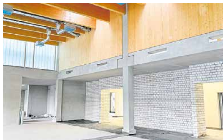
Blick ins Gebäude C (Elektrotechnik): Der Innenausbau ist hier in vollem Gange.

abgeschlossen und die ersten Innenausbauarbeiten laufen. Die Nordseite (Gebäude F-I) folgt, sobald die Gebäudehüllen mit Glaselementen und Sandwichpaneelen vollständig geschlossen sind. Dort entstehen die Werkstätten für Land- und Bauma-