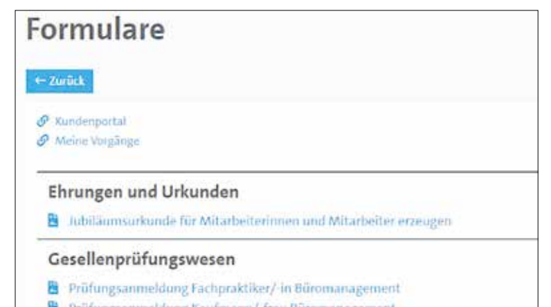
Unter dem Punkt Gesellenprüfungswesen finden sich die jeweiligen Formulare.