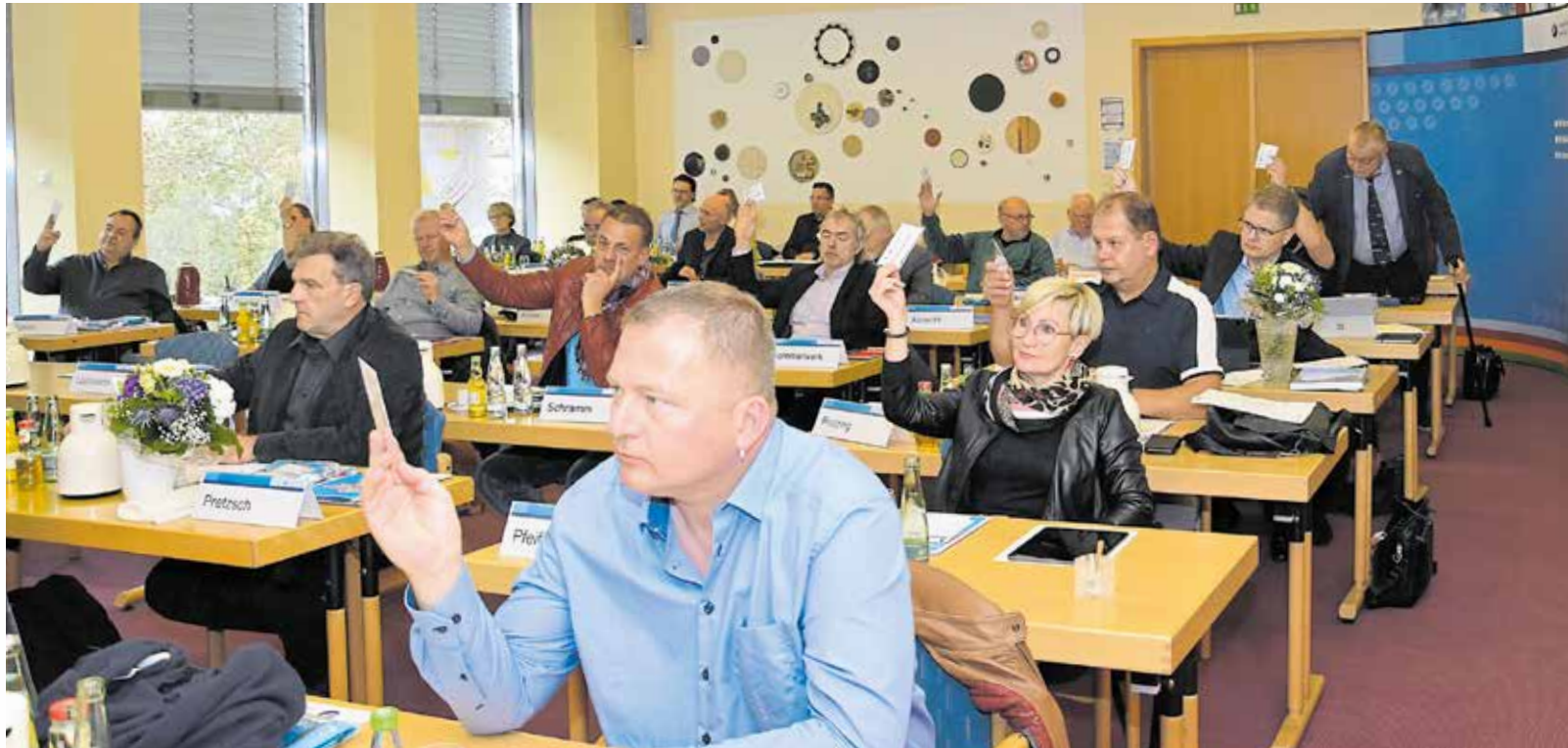
Die Vollversammlung der Handwerkskammer Halle kommt zweimal im Jahr zusammen, um über wichtige Entscheidungen abzustimmen und über aktuelle Themen zu beraten, die das Handwerk betreffen.