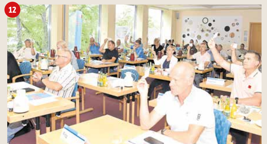
1 Aktionstag „Hände hoch fürs Handwerk“ – in diesem Jahr in Bernburg.