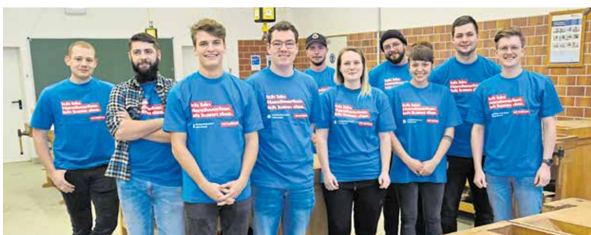
Die aktuelle Tischler-Meisterklasse bereitet sich im BTZ Stedten auf die Meisterprüfungen im Sommer vor.

schaft gefordert, um die Prüfungskommission von ihren meisterlichen Kompetenzen zu überzeugen. Und zwar nicht nur, was die Ausführung angeht, sondern auch die Planung und Kalkulation. Bis dahin werden die Tischlergesellen von den Ausbildern und Dozenten im Bildungs- und Technologiezentrum in Stedten intensiv auf die Meisterprüfungen vorbereitet. Im Vollzeit-Meisterkurs wird aber nicht nur das für die Meisterprüfungen nötige fachpraktische, sondern auch das fachtheoretische Wissen vermittelt. tk