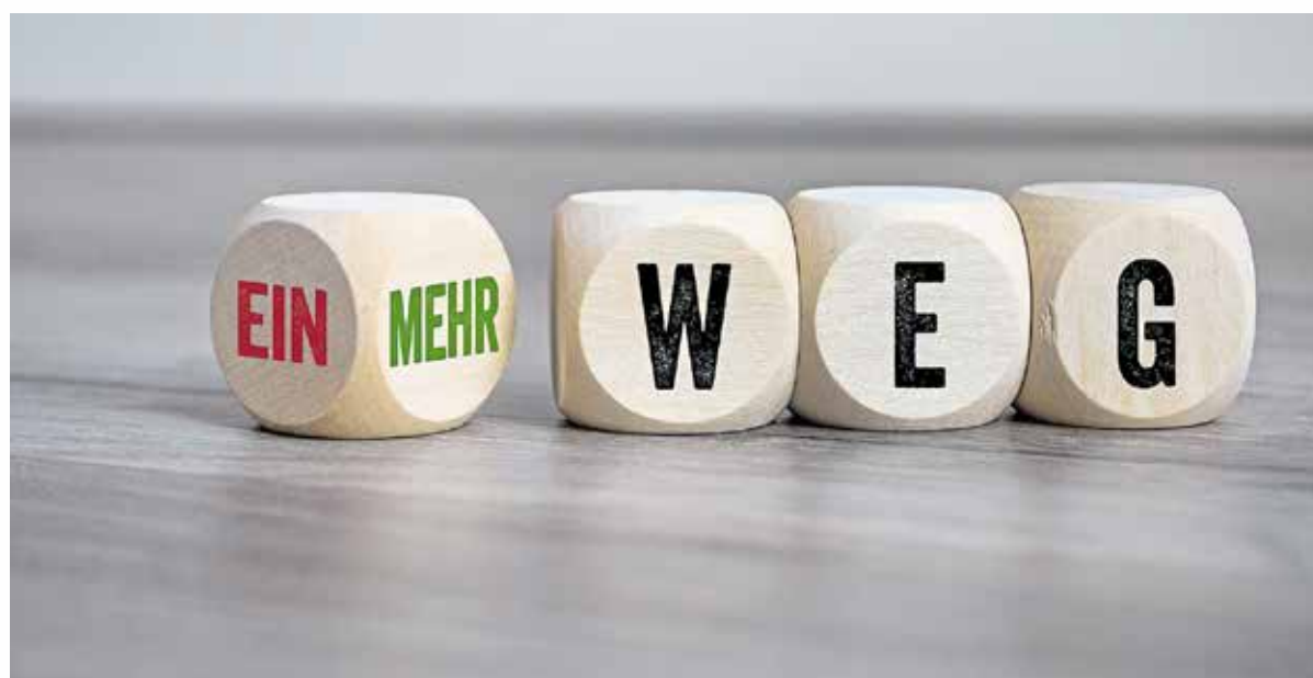
Die neuen Mehrwegregelungen betreffen auch Handwerksbetriebe. Diese wurden von der Handwerkskammer per Post angeschrieben und informiert.

Informationen: Tel. 0331/55047471, E-Mail: info@azubi-projekte.de ; www.azubi-projekte.de