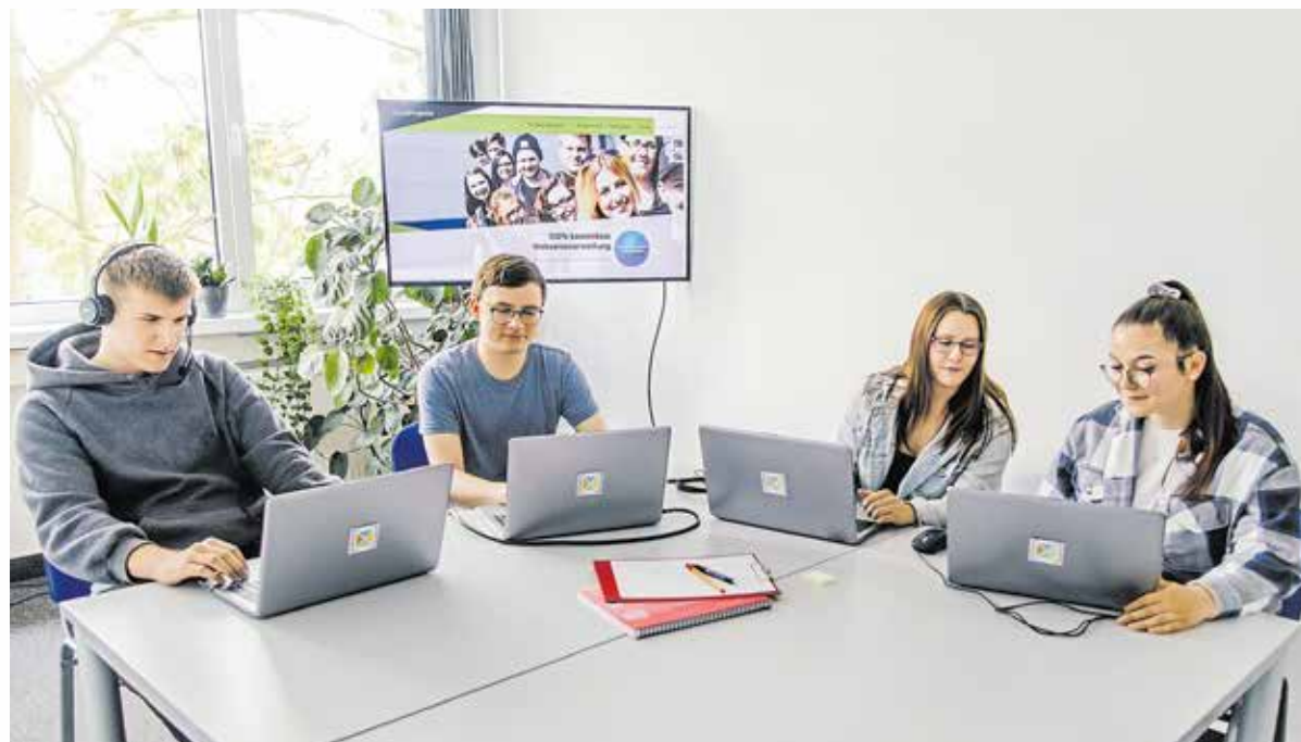
Azubis bei der Arbeit. Im Team erstellen sie Internetauftritte für Vereine, Institutionen und Betriebe.