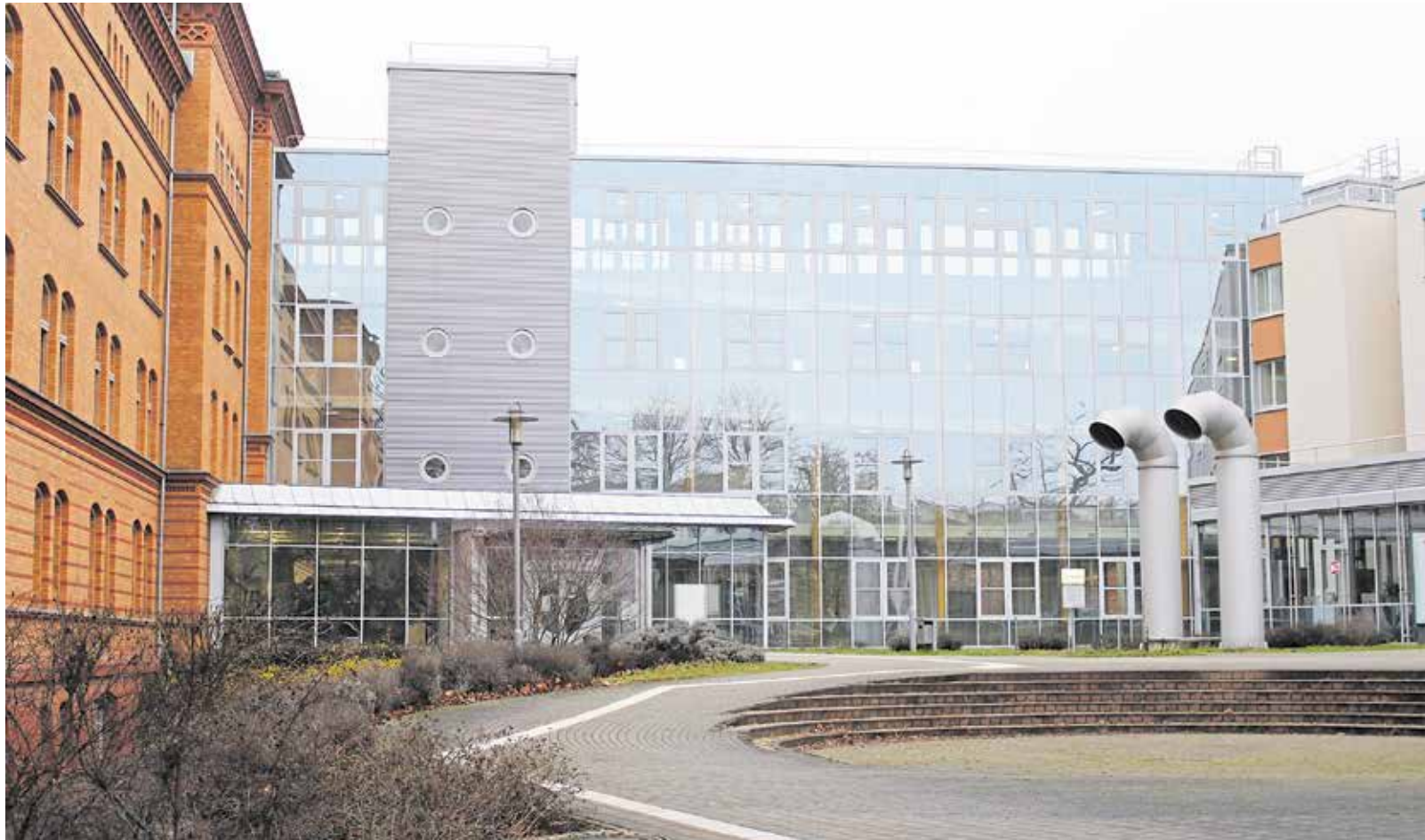
Die Agentur für Arbeit Halle (Bild) ist im Januar organisatorisch mit den Agenturen Sangerhausen und Weißenfels verschmolzen. Die Kompetenzen werden gebündelt und Dienstleistungen untereinander abgestimmt.