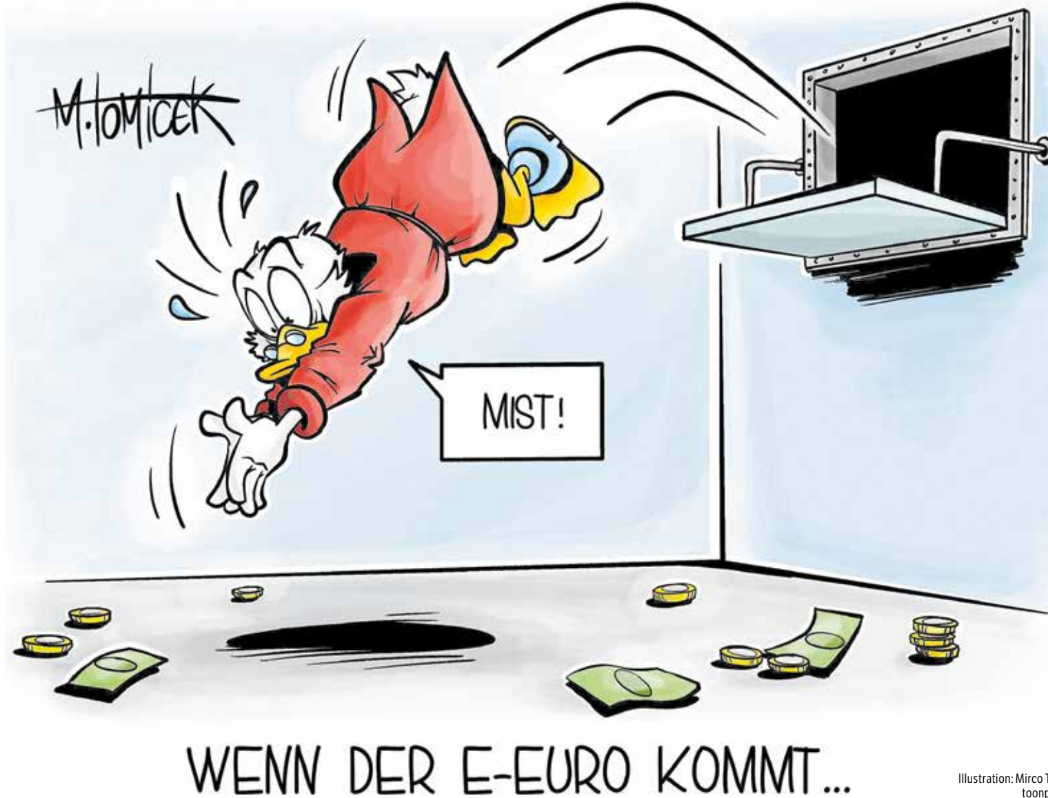
Illustration: Mirco Tomicek/toonpool.com

Für das Handwerk könnte der digitale Euro allerdings auch mit Investi-