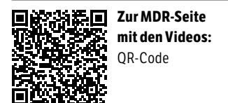
Zur MDR-Seite mit den Videos: QR-Code