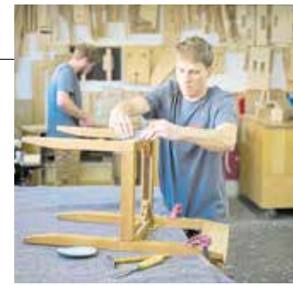
Schreinerei Zweites Leben für alte Möbel Seite 16