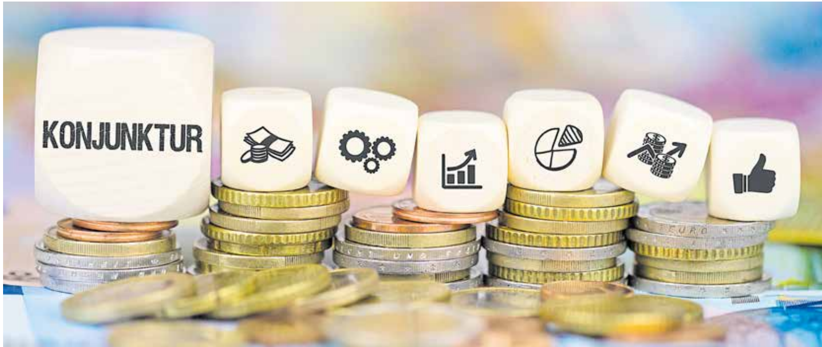
Die Konjunkturzahlen aus dem 4. Quartal 2025 zeigen keinen Aufwärtstrend. Das regionale Handwerk ist teils extrem belastet, unter anderem durch zu viel Bürokratie, hohe Abgaben und fehlende Fachkräfte.