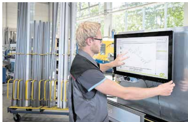
Auch in diesem Jahr werden Betriebe mit innovativen Digitalisierungsprojekten gesucht. Das beste wird mit 5.000 Euro prämiert.

Mit dem Wettbewerb möchten die Kammern zeigen, wie vielfältig digitale Innovation in Sachsen-Anhalt bereits gelebt wird. Die vorgestellten Erfolgsgeschichten sollen Inspiration bieten, Orientierung geben und andere Unternehmen ermutigen, eigene digitale Vorhaben umzusetzen. Teilnahmeberechtigt sind Unternehmen mit Sitz in Sachsen-Anhalt, die Mitglied einer Industrie- und Handelskammer oder einer Handwerkskammer sind und nicht mehr