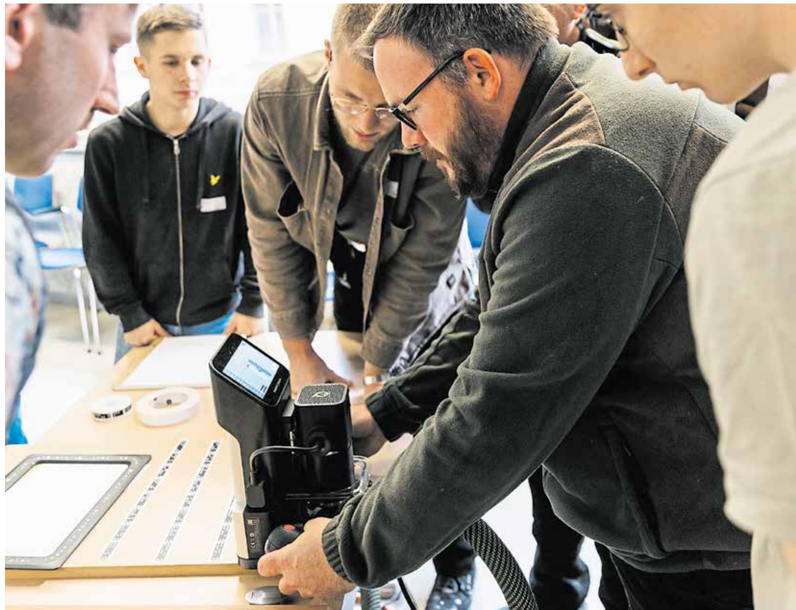
Wissen teilen und erhalten: Workshops gehören zum regelmäßigen Programm, das die Organisatoren der Generation N zusammenstellen.

Ein zentrales Element des Netzwerks ist zudem die digitale Wissensplattform. In Zusammenarbeit mit Partnertischlereien aus der Region werden regelmäßig hochwertige Wissensvideos produziert, die einzelne Techniken, Maschinen oder Arbeitsschritte anschaulich erklären. Ermöglicht wird dieses umfangreiche Engagement durch das Cross-Innovation-Programm, im Rahmen dessen das Projekt durch das Land Sachsen-Anhalt gefördert und durch die Europäische Union kofinanziert wird. Diese Förderung erlaubt es, Veranstaltungen und die Nutzung der Wissensplattform für die Mitglieder kostenfrei anzubieten und damit gezielt in Nachwuchsarbeit zu investieren.