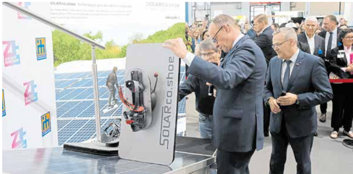
Erfindung aus dem Handwerk: Mit einem Spezialschuh lassen sich Solarmodule begehen, ohne dass Mikrorisse entstehen. Bundeskanzler Friedrich Merz und Handwerkspräsident Jörg Dittrich begutachteten den Solarschuh auf der Internationalen Handwerksmesse.

Beim Spitzengespräch auf der Internationalen Handwerksmesse fordern die vier großen Wirtschaftsverbände 2026 als Jahr der Reformen – Steigende Spritpreise verschärfen die Lage VON STEFFEN RANGE