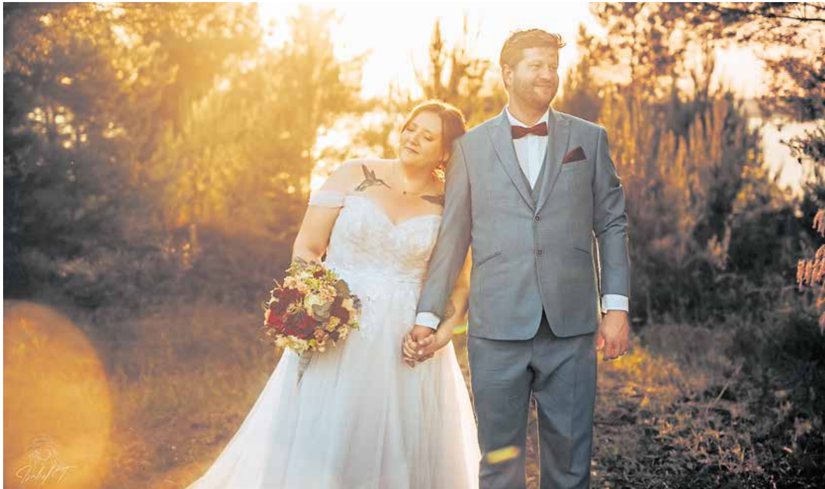
Ein besonderer Tag mit besonders intimen Momenten. Isabel Theis fotografiert viele Hochzeitspaare und versucht dabei immer, Erinnerungen zu schaffen, die beim Anschauen der Bilder wieder lebendig werden.