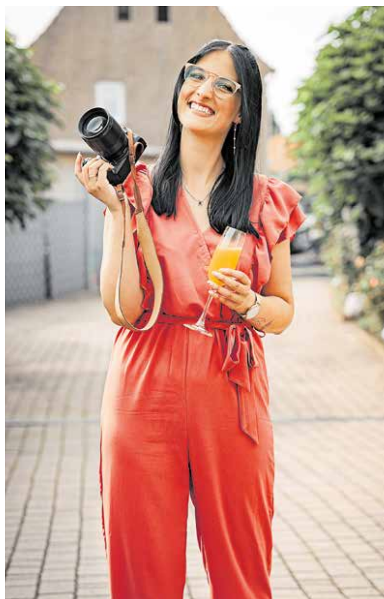
Ihre Leidenschaft für das Fotografieren hat Isabel Theis schon in der Kindheit entwickelt. Heute bietet sie unter anderem Hochzeits-, Porträt-, Familien- und Paar-Shootings an.

www.isabel-t-fotografie.de Facebook: Isabel Theis Bella Instagram: Isabel.t.fotografie